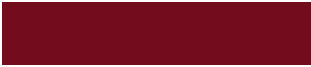
673- 051 schwedenrot ■ rouge suédois ■