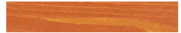
210-056 sanddorn ■ sea buckthorn ■ argousier rojo gayuba ■ olivello spinoso ■ tindvedrod