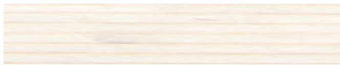
210-202 *weiß ■ white ■ blanc blanco ■ bianco ■ hvit