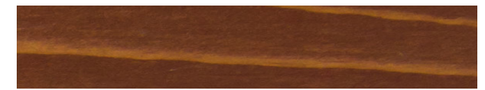
210-082 palisander ■ rosewood ■ palissandre palisandro ■ palissandro ■ palisander