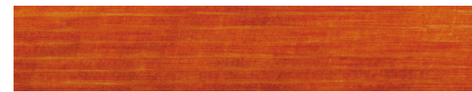
210-052 brasil ■ brazil ■ brésil brasil ■ brasile ■ brasil