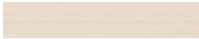
210-212 lichtgrau ■ light grey ■ gris clair gris alba ■ grigio chiaro ■ lysegra