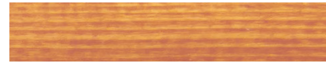
210-273 honigton-rötlich ■ dark honey ■ miel roux miel rojiza ■ rosso miele ■ rød honning