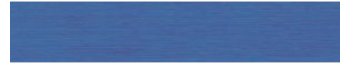
210-126 kornblume ■ cornflower ■ bleuet azul aciano ■ azurro pervinca ■ kornbloms