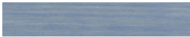
210-124 bauernblau ■ country blue ■ bleu rustique azul campestre ■ blu campagnolo ■ bondeblå