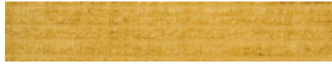
210-076 eiche ■ oak ■ chêne roble ■ quercia ■ eik