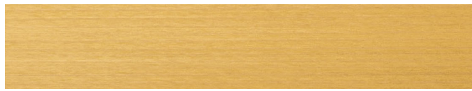
210-032 pinie ■ pine ■ pin parasol pin pinonero ■ pino ■ pinje