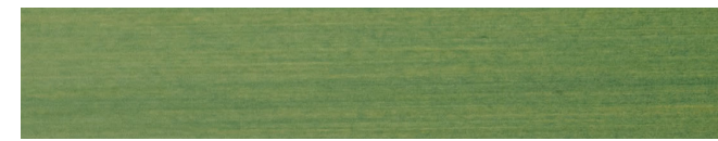
210-418 *avocado ■ avocado ■ avocat aguacate ■ avocado ■ avokado