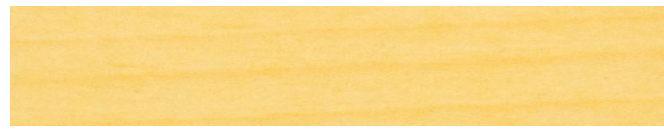
210-002 *farblos ■ clear ■ incolore incoloro ■ incolore ■ fargelos