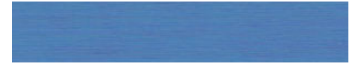
210-121 ultramarinblau ■ ultramarine blue ■ bleu outremer azul ultramar ■ blu oltremare ■ ultramarinebla