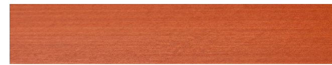
210-416 *blutorange ■ blood orange ■ orange sanguine naranja sanguina ■ rosso sangue ■ bloodappelsin