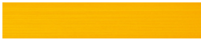
210-414 *mandarine ■ tangerine ■ manderine mandarina ■ mandarino ■ mandarin