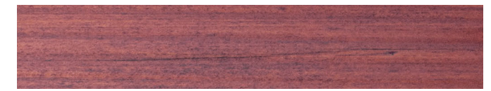
210-134 *flieder ■ lilac ■ lilas lila ■ lillá ■ syrin