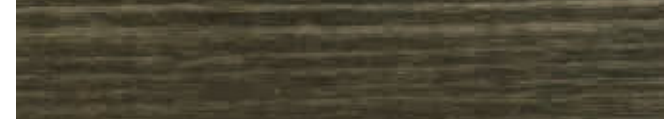
270 - 102 ebenholz ■ ebony ■ ébène ebano ■ ebano ■ ibenholt

*Gekennzeichnete Farbtöne nur für den Innenbereich. Die Farbtöne können drucktechnisch bedingt vom Original abweichen. ■ *Marked colors, only for the interior. Due to typographical differences, the color tones can be different from the original. ■ *Teintes utilisables uniquement à l'intérieur. Pour des raisons d'impression, l'exactitude de la reproduction des couleurs ne peut être garantie. ■ *Los colores marcados sólo adecuados para el uso en interiores. Los colores pueden variar con respecto del original, debido a la técnica de impresión.