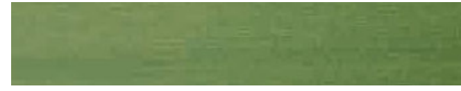
270 - 418 *avocado ■ avocado ■ avocat aguacate ■ avocado ■ avokado