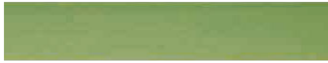
270-113 grün ■ green ■ vert verde ■ verde ■ grønn