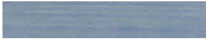
270 - 124 bauernblau ■ country blue ■ bleu rustique azul campestre ■ blu campagnolo ■ bondeblå