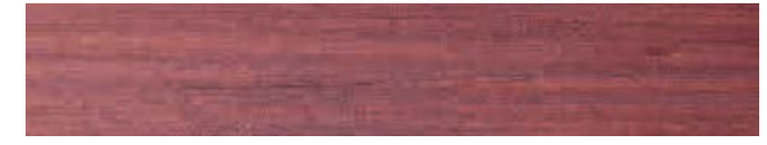
270 - 134 *flieder ■ lilac ■ lilas lila ■ lillá ■ syrin