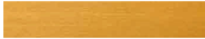
270-012 *kiefer ■ spruce ■ pin pino ■ pino ■ furu