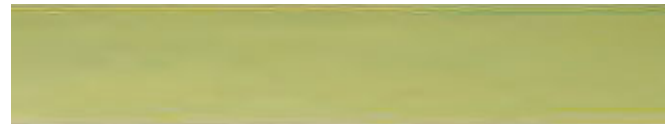
270-417 *kiwi ■ kiwi ■ kiwi kiwi ■ kiwi ■ kiwi