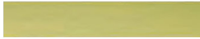
270-116 linde ■ lime ■ tilleul tilo ■ tiglio ■ linde