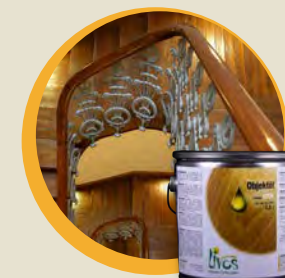
KUNOS Objektöl Nr. 241