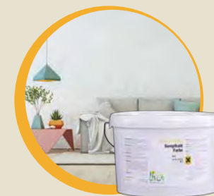
STRUTIVOS Sumpfkalk Feinputz Nr. 471

Von professionellen Handwerksbetrieben und ambitionierten Hobbyheimwerkern