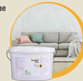
STRUTIVOS Sumpfkalkfarbe Nr. 475

Umweltschonende Wandgestaltung? Die Sumpfkalkfarbe wirkt schimmelabweisend und ist in großer Farbauswahl erhältlich. Die Farbe beugt Schimmelbildung in Feuchträumen vor und ist zudem für Allergiker, Geruchs- und Chemikaliensensible geeignet.