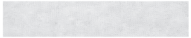
1021 - 202 weiß ■ white ■ blanc ■ blanco bianco ■ hvit