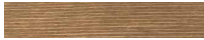
244 - 069 2x tabak ■ tobacco ■ tabac tobaco ■ tobacco ■ tobakk