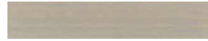
244 - 794 2x achatgrau ■ agate grey ■ gris agate gris ágata ■ agatgrå