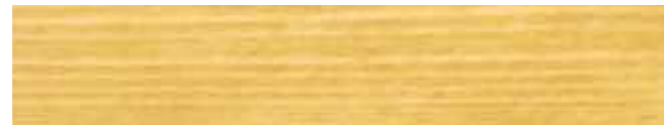
244 - 425 2x ulme ■ elm ■ orme olmo ■ olmo ■ alm