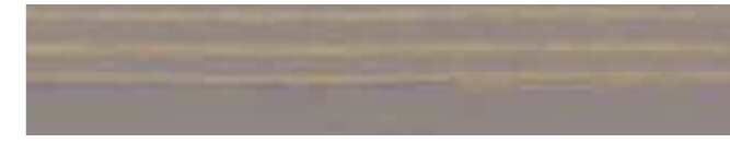
244 - 748 2x schiefergrau ■ slate grey ■ gris ardoise pizarraoscuro ■ skifergrå