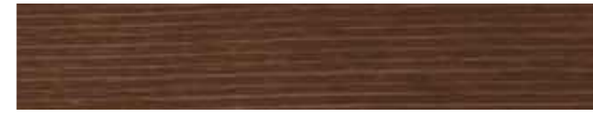
244 - 437 2x black bean ■ black bean ■ châtaignier d'australie castano de australia ■ fagiolo messicano svart bonne