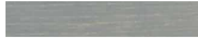
244 - 922 2x silbergrau ■ silver grey ■ gris argent gris plateado ■ argento-grigio ■ sølvgrå