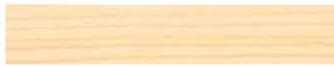
244 - 204 1x weiß ■ white ■ blanc blanco ■ bianco ■ hvit