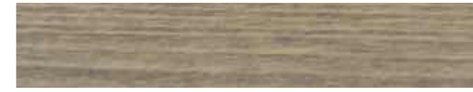
244 - 426 2x ulme grau ■ elm grey ■ orme gris olmo gris ■ olmo grigio ■ alm grå