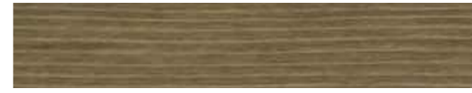
244 - 088 2x gerauchte eiche ■ smoked oak ■ chêne fumé roble ahumado ■ quercia bruciata ■ rokt eik