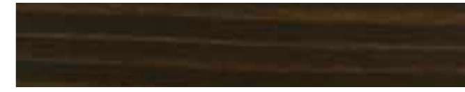
244 - 427 2x ulme dunkelbraun ■ elm dark brown orme brun foncé ■ olmo marrón oscuro olmo marrone scuro ■ alm mørkebrun