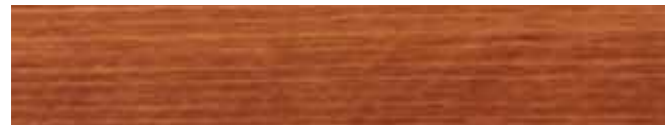
244 - 429 2x kirsche intensiv ■ cherry intensive cerisier intense ■ cerezo intenso ■ ciliegio intenso kirsebær intensiv