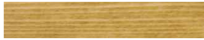
244 - 089 2x eiche-antik ■ antique oak ■ chêne rustique roble antiguo ■ quercia antica ■ eik antikk