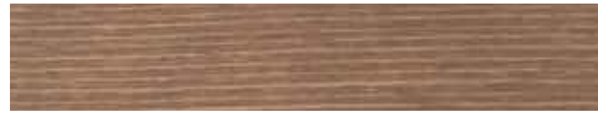
244 - 082 2x palisander ■ rosewood ■ palissandre palisandro ■ palissandro ■ palisander