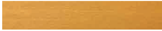
270-012 *kiefer ■ spruce ■ pin pino ■ pino ■ furu