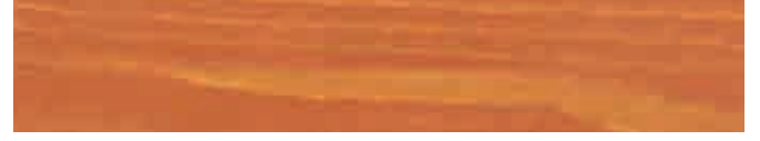
270-056 sanddorn ■ sea buckthorn ■ argousier rojo gayuba ■ olivello spinoso ■ tindvedrod