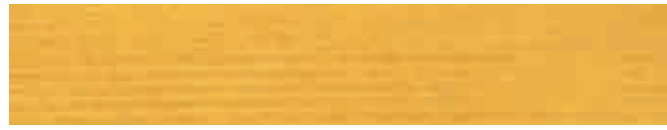
270-022 buchsbaum ■ boxtree ■ buis boj ■ bosso ■ buksbom