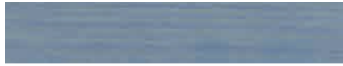
270-124 bauernblau ■ country blue ■ bleu rustique azul campestre ■ blu campagnolo ■ bondeblå