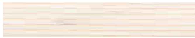
270-202 *weiß ■ white ■ blanc blanco ■ bianco ■ hvit