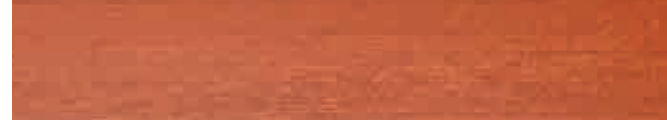
270-416 *blutorange ■ blood orange ■ orange sanguine naranja sanguina ■ rosso sangue ■ bloodappelsin