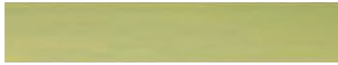
270-116 linde ■ lime ■ tilleul tilo ■ tiglio ■ linde