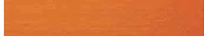
270-415 *orange ■ orange ■ orange naranja ■ arancio ■ appelsin