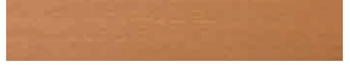
270-042 teak dunkel ■ dark teak ■ teck foncé teca oscura ■ teak scuro ■ mørk teak