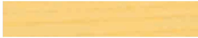
270-002 *farblos ■ colourless ■ incolore incoloro ■ incolore ■ fargelos