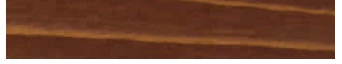
270-082 palisander ■ rosewood ■ palissandre palisandro ■ palissandro ■ palisander