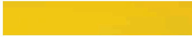
270-413 *zitron ■ lemon ■ citron limón ■ limone ■ sitron