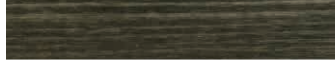
270-102 ebenhholz ■ ebony ■ ébène ebano ■ ebano ■ ibenholt

*Gekennzeichnete Farbtöne nur für den Innenbereich. Die Farbtöne können drucktechnisch bedingt vom Original abweichen. ■ *Marked colors, only for the interior. Due to typographical differences, the color tones can be different from the original. ■ *Teintes utilisables uniquement à l'intérieur. Pour des raisons d'impression, l'exactitude de la reproduction des couleurs ne peut être garantie. ■ *Los colores marcados sólo adecuados para el uso en interiores. Los colores pueden variar con respecto del original, debido a la técnica de impresión.