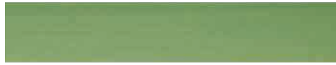
270-113 grün ■ green ■ vert verde ■ verde ■ grønn