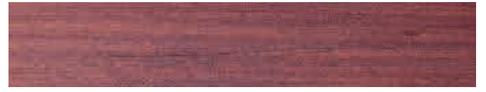
270-134 *flieder ■ lilac ■ lilas lila ■ lillá ■ syrin