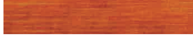
270-052 brasil ■ brazil ■ brésil brasil ■ brasile ■ brasil